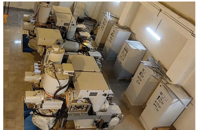
پست ۱۳۲ کیلوولت GIS حامد