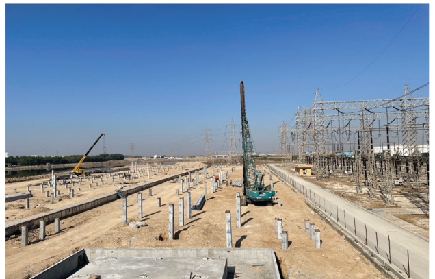
توسعه پست ۴۰۰ کیلوولت پتروشیمی فجر