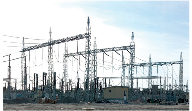
پست ۲۳۰/۶۳ کیلوولت سردرگان