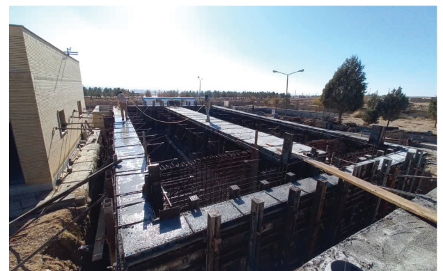
تصفیه خانه شاهرود